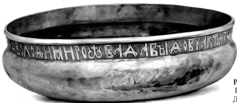
Рис. 1. Чара Владимира Давыдовича (фото).